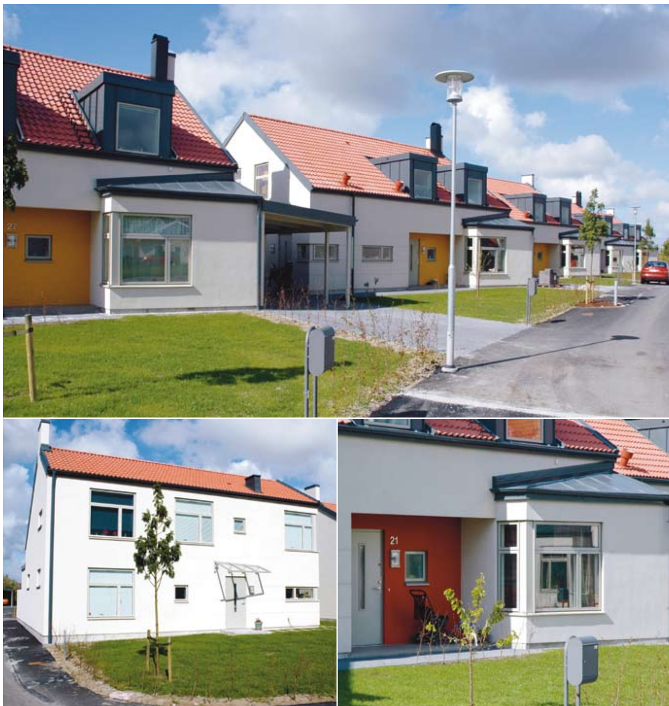
Kv Palteboken i Lund har byggts med celblocket och med bjälklagelementet mellan våningarna.