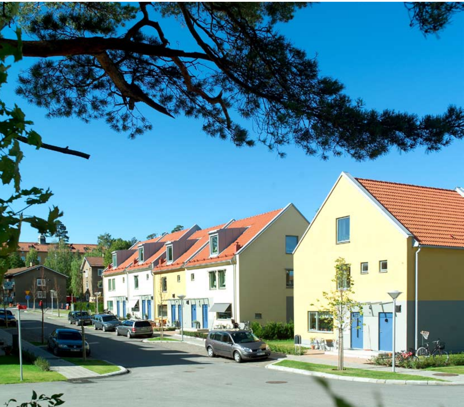
Kv Ekkällan i Linköping har byggts med stående väggelementet.

Stående väggelementet är en ekonomisk lösning till större byggprojekt i ytter- och innerväggar. Få elementtyper gör att byggandet går snabbt och det enkla systemet ger projekteringsfördelar. Standardprodukter ger snabba och säkra leveranser till byggarbetsplatsen enligt en uppgjord leveransplan för snabb och enkel montering. Vårt massiva väggelementet har släta fogar som eliminerar arbetet med eftergjutning. Våra standardprodukter kan kombineras till vackra och intressanta fasadutformningar. Även detta system kan kombineras med innerväggar av lättbetong.