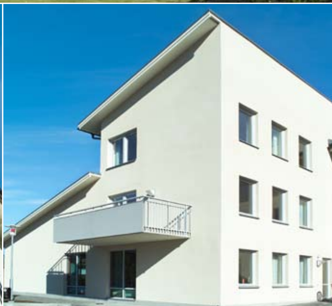
Kv Råven i Jönköping har byggts med celblocket.